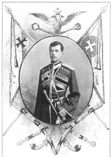
ЕГО ИМПЕРАТОРСКОЕ ВЫСОЧЕСТВО ГОСУДАРЬ НАСЛѢДНИКЪ ЦЕСАРЕВИЧЪ И ВЕЛИКІЙ КНЯЗЬ НИКОЛАЙ АЛЕКСАНДРОВИЧЪ АВГУСТЫЙШІЙ АТАМАНЪ ВСѢХЪ КАЗАЧЬИХЪ ВОЙСКЪ