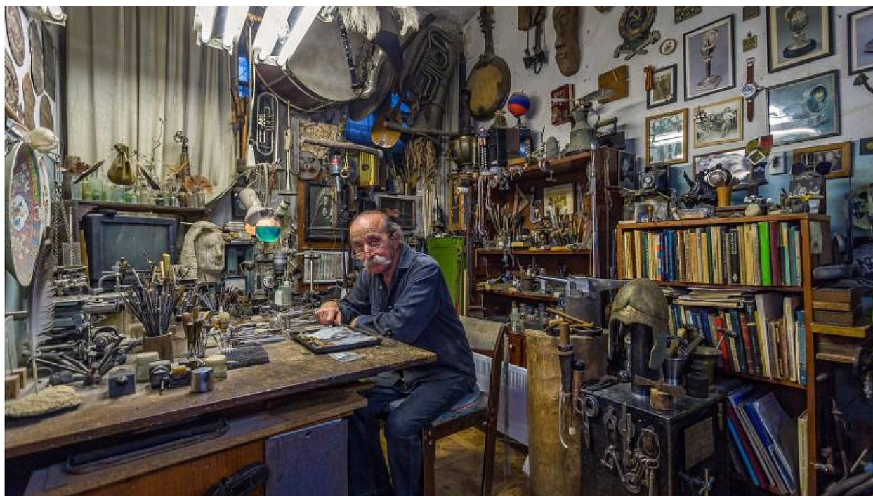
исторические ценности музея