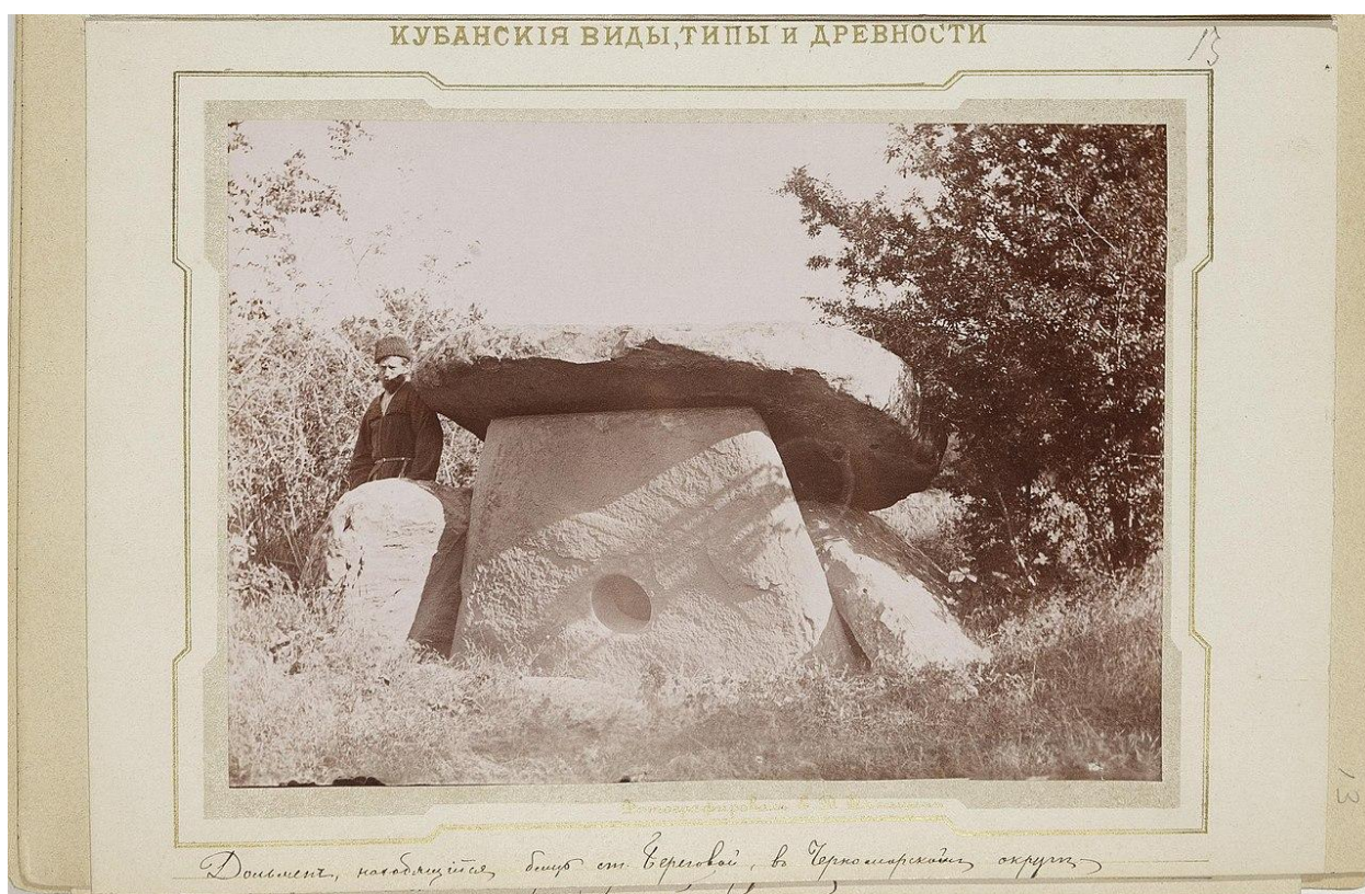
фотография дольменов А. Д. Фелицына